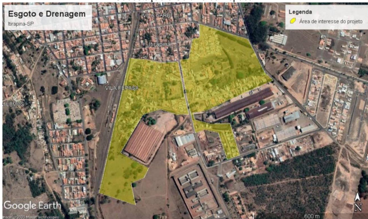
Figura 1. Área de intervenção para a melhora dos bairros Campo do Ima, Pátio da Subestação e Colônia da Fepasa